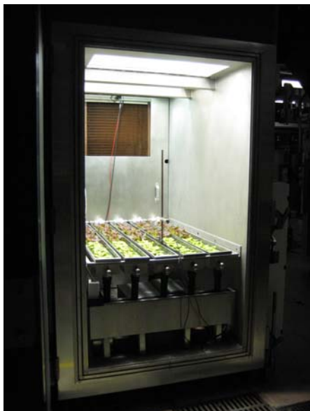
Sla teelt op Grodan substraat in een hyperbare kamer.

Dit geavanceerde, recyclebare steenwol substraat van Grodan, is speciaal ontwikkeld voor 'Precision Growing'. Precision Growing is de meest efficiënte en effectieve en duurzame teeltwijze, waarbij met een minimale inzet van middelen (water, energie, voedingsstoffen, ruimte) een maximaal resultaat (opbrengst, kwaliteit, productietijd) wordt gerealiseerd. En dat is precies waar ook de onderzoekers in Canada op uit zijn. Voor Grodan heeft deze samenwerking veel voordelen. Met de resultaten die in het onderzoek behaald worden, scherpt Grodan de doelstellingen van Precision Growing verder aan. Precision Growing wordt hiermee naar een nog hoger plan getild, waardoor tuinders hun teelt nog beter kunnen beheersen en daarmee hun teeltresultaat nog verder kunnen verbeteren. Zo kan een missie naar Mars de high tech tuinbouw helpen om verder te verduurzamen en daar draagt Grodan zijn steentje ook graag aan bij.